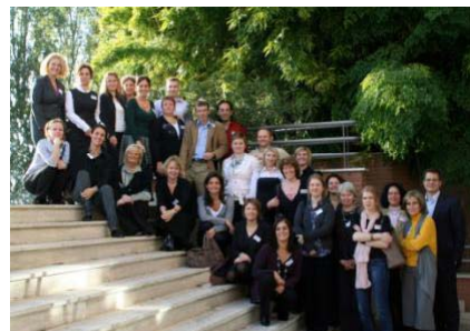
25 Vertreter von 16 Ländern, 18. Nov. 2008 Rom