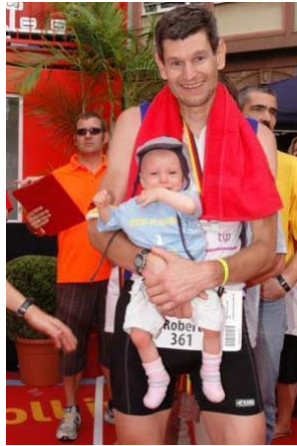
Frühchenvater und Ironman-Teilnehmer