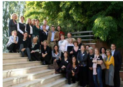
25 Vertreter von 16 Ländern, 18. Nov. 2008 Rom

EFCNI european foundation for the care of newborn infants.