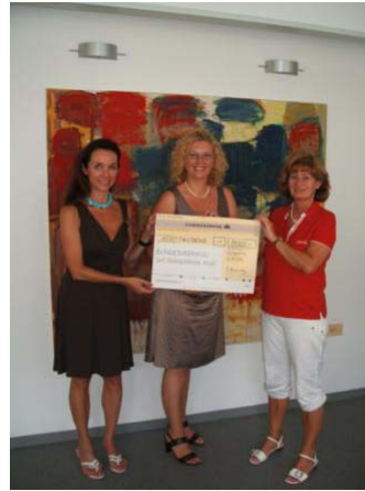
Scheckübergabe mit Schirmherrin